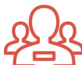
Actividades en grupo

Oferta de viaje combinado organizado y comercializado por la agencia de viajes CLUB CLAN 2000, S.L. (que opera bajo la marca comercial Gruppit y es titular del dominio www.gruppit.com ), con NIF B63625388, domicilio social en Barcelona (08036) en C/ Provença 212, bajos, Tel: 93.452.76.78 y que dispone también de oficina comercial en Madrid (28001) en C/ Velázquez 57, bajos, con telf. 91.423.70.58. También puede contactar con CLUB CLAN 2000, S.L. a través del e-mail de contacto: info@gruppit.com .