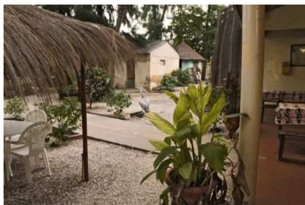
Joal Fadiouth: Hotel Le Finio