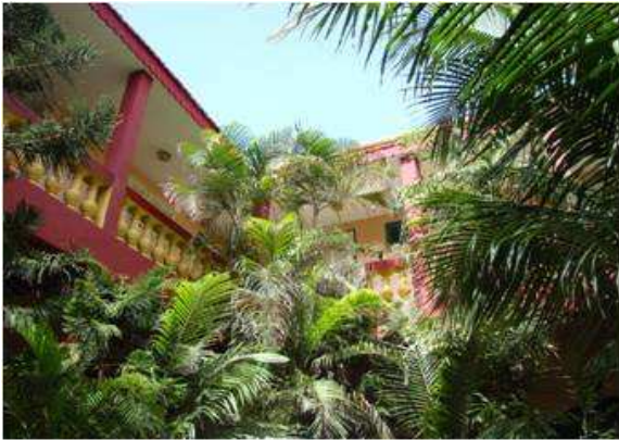
Dakar: Hotel Saint Louis Sun