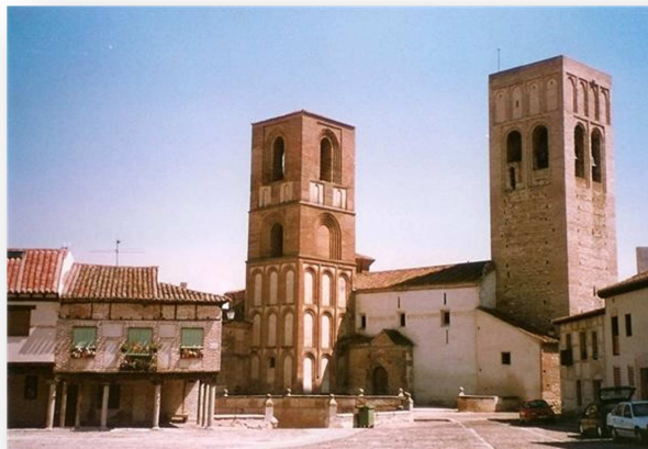
Iglesia de San Martín

... Continuación: Nos acercamos al pueblo de Arévalo, otro centro histórico en esta mañana especial