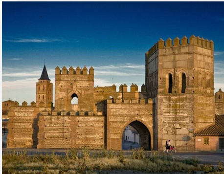
Antigo palacio de Juan II

Tomamos fuerzas y nos disponemos a recorrer, preguntar, curiosear, descubrir... y acercarnos a una de las Joyas de nuestro viaje: En Madrigal de las Altas Torres conoceremos la Casa natal de la Reina Isabel.