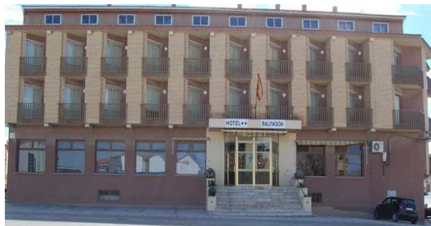
Hotel Calanda Balfagón

El hotel donde nos alojaremos es el Calanda Balfagón, El Hotel Balfagón se encuentra en la Villa Calanda (Teruel), a 5 minutos del circuito de Motorland, y a una hora de Zaragoza. Con un ambiente muy acogedor y basado en el trato familiar, nuestro Hotel cuenta con 34 Habitaciones dobles, todas ellas con WIFI Gratuito.